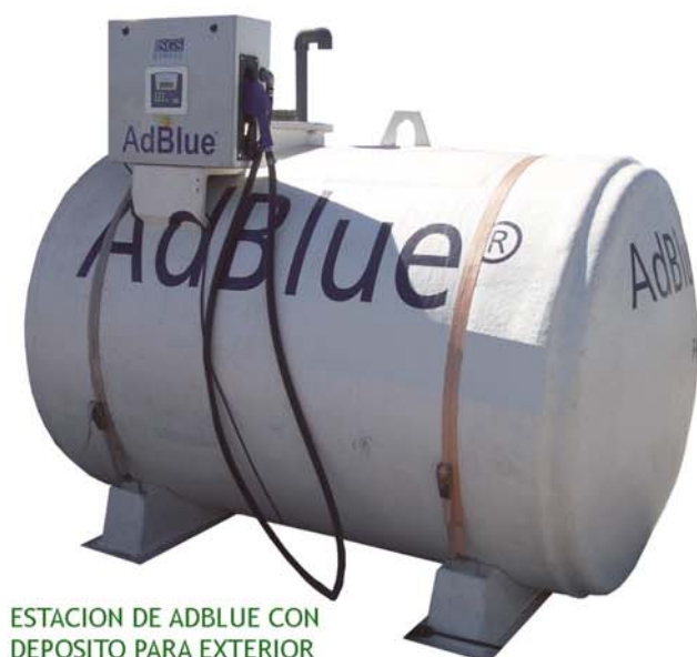
ESTACION DE ADBLUE CON DEPOSITO PARA EXTERIOR Y GRUPO DE BOMBEO INTEGRADO AL SURTIDOR

Depósitos fabricados en poliéster con recubrimiento especial Adblue, con doble pared y aislamiento térmico.